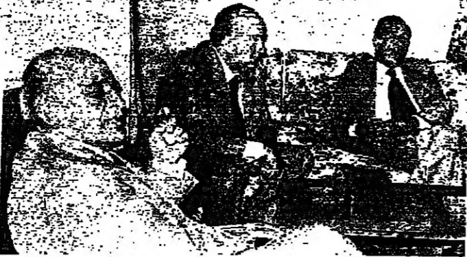
الرئيس سلام أثناء اجتماعه بالعميد اده ، ويبدو الدكتور جيسل كبي

ورأي القرب وامس عبر الرئيس كمال الأسد في دولته الصلحية عن رأي هذه الكتيرة النيابية عندما أكد بان عودة الجهود الى البلاد لا يعني ان الخوف الذي يسيطر على المواطنين قد زال ولا يعني ان الحكومة التي جاءت من اجل مهمة مرموقة قد نجحت نجاحا في مهمتها . ويقول الأسد ان الاسباب التي امت الى وقوع الحوادث الأخيرة هي بجمعها اسباب اجتماعية وان كانت قد تولدت الطليان ، وحسب شهر ليلول القتل والتي سنجع بين الكتائب وبين جنبلات في وقت واحد ، خصوصا ، وفيه لا الكتائب ولا جنبلات يقبل بان تبقى الحكومة السادسة حتى موعد الانتخابات العامة .